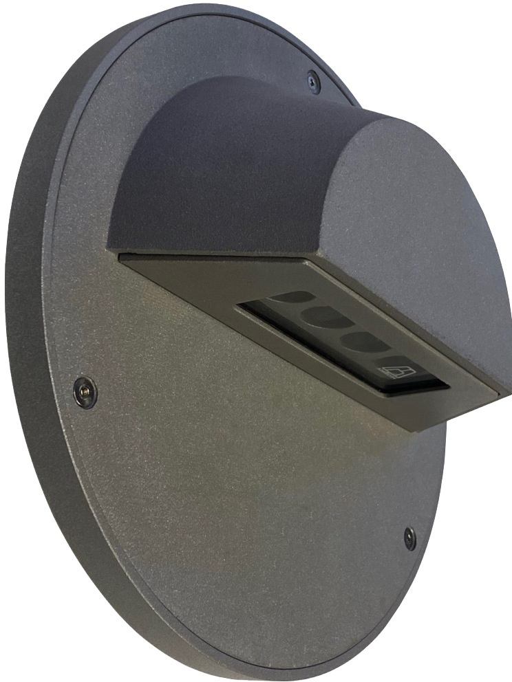
Ø: 23.5 cm

Uso: Exteriores / Interiores, NO SUMERGIBLE. Protección: IP-64 Instalación: Fijar en muro. Material: Fundición de Al. Difusor: Cristal templado. Tornillería: Acero Inox. Empaque: Silicón vulcanizado. Acabado: Pintura electrostática (Polyester). Color: Bronce Viejo. Lámparas: 4 LEDS, 12 W totales. Ópticas: Elíptica (11° - 52°), haz de luz paralelo al plano. Fuente de Poder: Interna (Driver). Temp. color: 2700° K. Flujo luminoso: 1104 Lm CRI: 90. Voltaje: 127 - 277 VCA