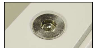
Tornillo de Seguridad (FSTPH)

Antes de dar mantenimiento al luminario, asegurese de que esté des-energizado. Revise la compatibilidad de voltaje y utilice línea de tierra física, limpie todos los componentes y revise las conexiones eléctricas.